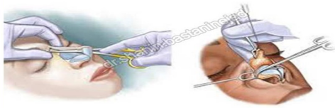
رینوپلاستی و انواع آن

• تا وقتی به شما گفته نشده است از فین کردن پرهیزید. با دهان باز عطسه و سرفه کنید و از حرکات شدید صورت حین خنده و گریه اجتناب کنید.